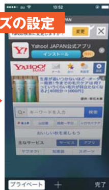
②白枠の「プライベート」をタップします。