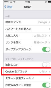
③「Cookieをブロック」をタップします。