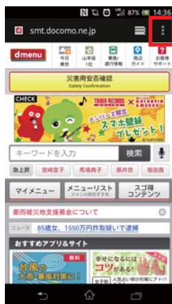
① ブラウザーの設定をタップします。

下記は Android での設定方法です。機種によって設定方法は異なりますのでご利用の携帯電話の各キャリアまでお問い合わせをお願いいたします。