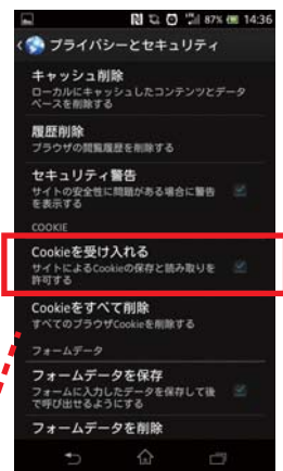
④ 「cookieを受け入れる」を有効にします。