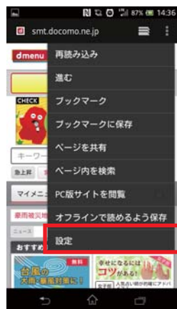
② 「設定」をタップします。