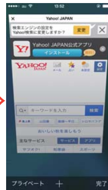
④「プライベート」の白枠が無くなったことを確認ください。