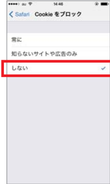
④「しない」に設定します。