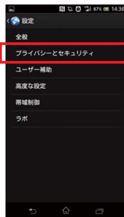
③ 「プライバシー」をタップします。