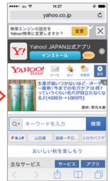
⑤「プライベートブラウズ」が「OFF」になり、上下の枠が白く変わります。